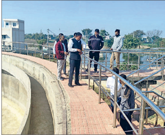
भिवानी। निर्माण कार्यों की जांच करती सीएम फ्लाइंग।

दो एचकेआरएन के तहत नियुक्त कर्मचारी गैर हाजिर मिले। उनकी छुट्टी व अन्य कोई जानकारी होने के बारे में पूछा तो जानकारी नहीं मिली। करीब दो घंटे बाद दोनों कर्मचारी कार्यालय में पहुंच गए। जिस पर उनकी भविष्य में बिना बताए कार्यालय से बाहर न रहने की चेतावनी दी। इस दौरान फैंसी चौक पर विगत में बने सीवर के मेनहोल पर खर्च हुई राशि में अनियमितता मिली। जिसकी बारीकी से जांच की गई। जांच के बाद टीम ने उक्त कार्य की जांच के लिए मुख्यालय भेज दिया।