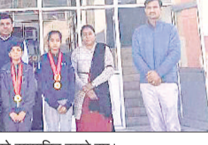
नारनौल। स्कूल में विजेता विद्यार्थियों को सम्मानित करते हुए।

जिला स्तरीय द्वितीय किड्स एथलेटिक्स प्रतियोगिता में विद्या देवी इंटरनेशनल स्कूल अटेली के खिलाड़ियों ने एक बार फिर अपनी प्रतिभा का लोहा मनवाते हुए विद्यालय का नाम गौरवान्वित किया। महेंद्रगढ़ के स्पोर्ट्स स्टेडियम में आयोजित इस प्रतियोगिता में जिले के 300 से अधिक खिलाड़ियों ने भाग लिया, लेकिन वीडीडाईएस के होनहारों ने अपने जुनून व मेहनत से सबको