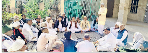
भिवानी। आयोजित पंचायत में अपना सुझाव रखता एक वक्ता।

गांव खरक में मंगलवार को धामाण खाप-12 की एक मीटिंग आयोजित की गई। इस मीटिंग में समाज में तेजी से पैर पसार रही विभिन्न सामाजिक बुराईयों और पाश्चात्य संस्कृति के प्रभाव पर गहरी चिंता व्यक्त की गई। खाप ने सर्वसम्मति से निर्णय लिया है कि अब केवल बैठकों तक सीमित न रहकर, गांव-गांव जाकर एक व्यापक जागरूकता अभियान चलाया जाएगा। मीटिंग के दौरान