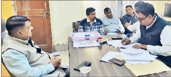
भिवानी। निरीक्षण के दौरान रिकार्ड की जांच करती सीएम फ्लाइंग का दस्ता।

मंगलवार को सीएम फ्लाइंग ने लोक निर्माण विभाग के एसडीओ बतौर ड्यूटी मजिस्ट्रेट की अगुवाई में पब्लिक हेल्थ विभाग में छापा मारा। छापे के दौरान दो एचकेआरएन के तहत नियुक्त कर्मचारी गैर हाजिर मिले। हालांकि दोनों कर्मचारी दो घंटे बाद कार्यालय में पहुंच गए थे, लेकिन उनका छुट्टी पर रहने की पूर्व सूचना देने की हिदायत देकर छोड़ा गया। दूसरी तरफ टीम ने निर्माण कार्यों का रिकार्ड छाना तो उसमें कई खासियां मिली। जिसके चलते फैंसी चौक पर सीवर लाइन के उपर